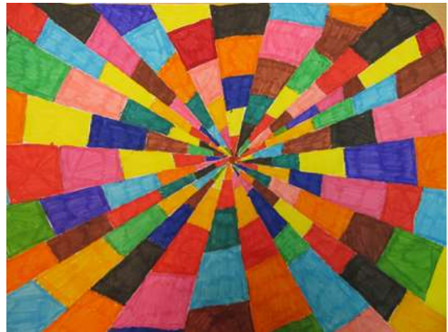
Elis Lutterus „Värvide maailm“